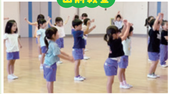
桜川市立やまと認定こども園 6/14◎