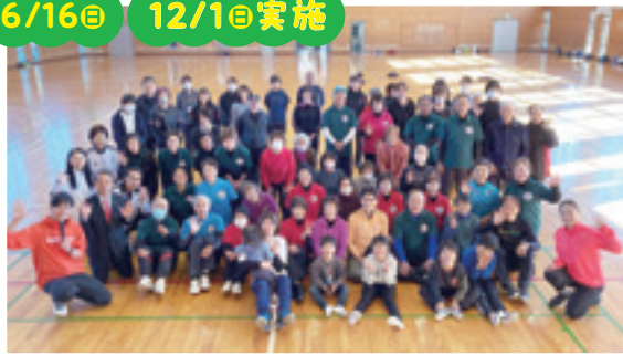
岩瀬体育館「ラスカ」6/16◎